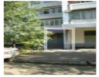
Рис. 4. Месторасположение парикмахерской

Собственнику желательно создать поток посетителей хотя бы 150 человек в неделю. Ассигнования, выделенные собственником на продвижение парикмахерской – не более 100 000 рублей. На той же улице четыре месяца назад открылась парикмахерская-конкурент на 4 посадочных места. Никаких услуг, кроме стрижки, не оказывают. Помещение крохотное, люди ждут своей очереди прямо в салоне. Работают 18-летние гастарбайтеры из Молдовы и Украины.